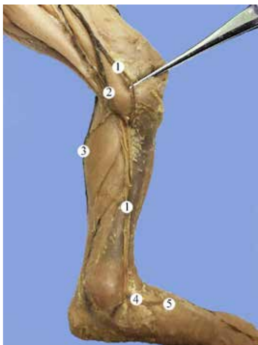
Рис. 1. Поверхні вени лівої гомілкової ділянки плода 195,0 мм ТКД. Присередня проекція. Фото макропрепарату. Зб. 2,1 а :

Зазвичай, велика підшкірна вена є продовженням присередньої крайової вени. У плода 195,0 мм ТКД ліва велика підшкірна вена утворена трьома притоками присередньої крайової вени, яка, в свою чергу, є продовженням тильної венозної сітки стопи. У ділянці гомілки велика підшкірна вена представлена основним стовбуром, довжиною 43,0 мм. На рівні переходу гомілкової ділянки у колінну від основного стовбура великої підшкірної під кутом 45° бере свій початок задня додаткова підшкірна вена, яка анастомозує з малою підшкірною веною (рис. 1). У задню додаткову підшкірну вену впадають пронизні вени присередньої поверхні гомілки.