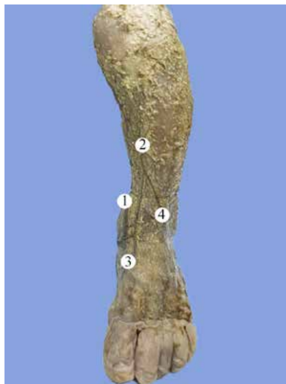
Рис. 2. Поверхні вени лівої передньої гомілкової ділянки плода 220,0 мм ТКД. Фото макропрепарату. Зб. 2,3 а :

У плода 220,0 мм ТКД у формуванні лівої передньої додаткової підшкірної вени брали участь притоки бічної та присередньої крайових вен. Останні прямували з відповідного краю стопи і на межі нижньої і середньої третин гомілки утворювали передню додаткову підшкірну вену. Велика підшкірна вена у своїй початковій частині анастомозувала з присередньою крайовою веною та прямувала вгору над присередньою кісточкою великогомілкової кістки (рис. 2).