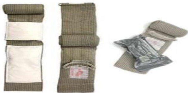
Рис. 4. Ізраїльський бандаж

В основі він містить еластичний бинт з пришитою подушечкою для вбирання крові, різьками для створення давлючого зусилля на рану, наклейкою для швидкого розміщення подушечки на рані, фіксатором на кінці бинта для закріплення бандажа на тілі. Як аналог можна використовувати еластичний бинт, щоб створити достатній тиск на рановий канал.