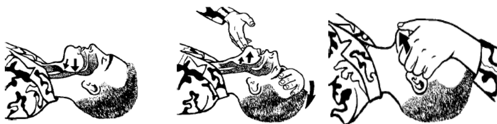
Рис. 2. Методи забезпечення прохідності дихальних шляхів.

1) покладіть одну руку на лоб постраждалого, іншу розмістіть знизу під шиєю і обережно закиньте голову назад; 2) відкрийте рот постраждалого; 3) виведіть нижню щелепу постраждалого вперед. Показання: 1) негайна допомога у разі загрози западання або у разі западання язика; 2) полегшення дихання постраждалого у свідомості (рис. 2) [1; 5–8]. У разі підозри на травму шийного відділу хребта обмежтесь відкриванням рота та виведенням щелепи постраждалого.