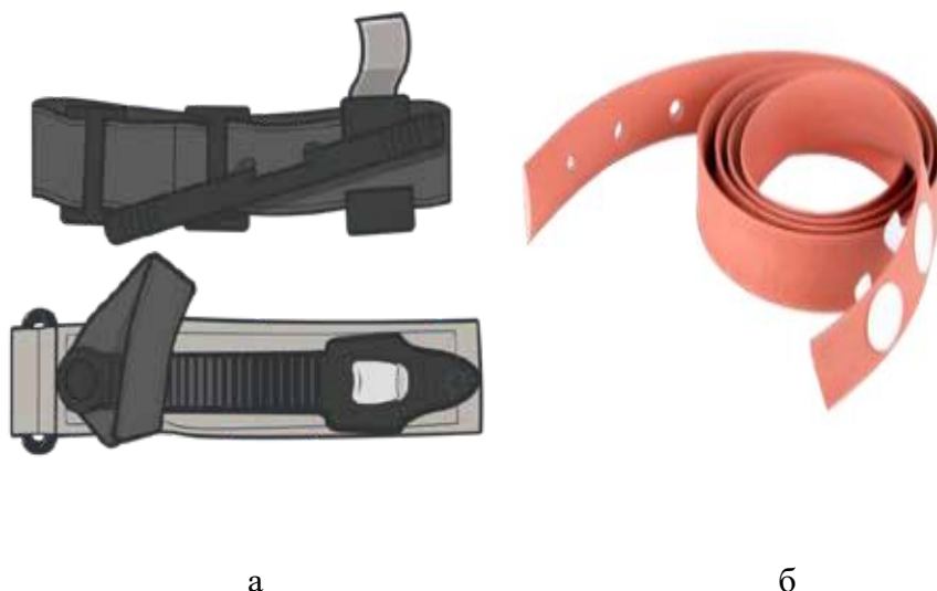
Рис. 1. Турнікет САТ(а) та аналог джгут Есмарха (б)

4. Повинен бути зафіксований час накладання турнікету.